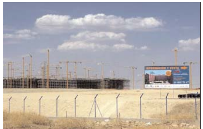
Urbanització illegal en Seseña.